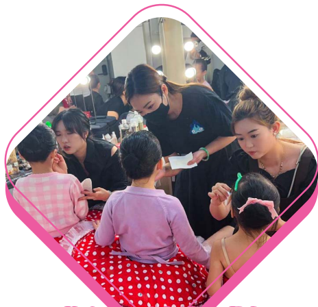
擔任舞蹈表演化妝師