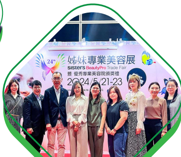
出席姊妹專業美容展， 認識美容行業最新發展趨勢