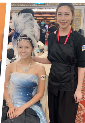
參加國際彩妝比賽