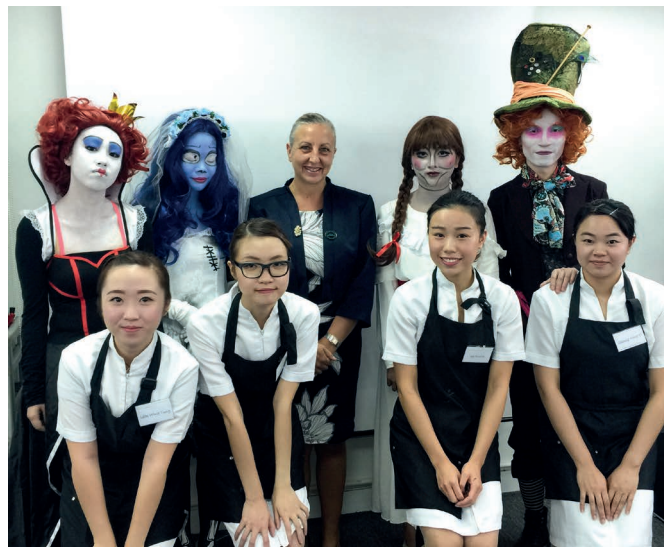
參加化妝國際證書考核