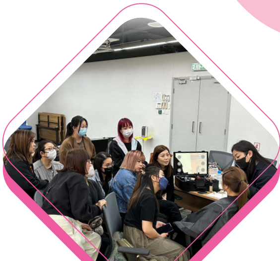
參與《屈臣氏體壇之星》 化妝訓練工作坊