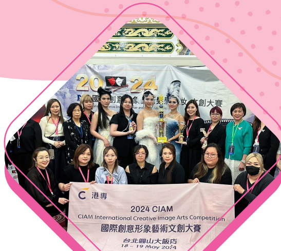
參加國際創意形象藝術 文創大賽2024 並獲國際團體獎