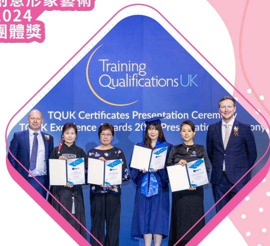
課程導師入圍 TQUK卓越導師獎