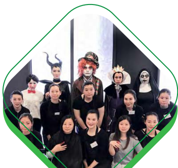
參與國際證書考核