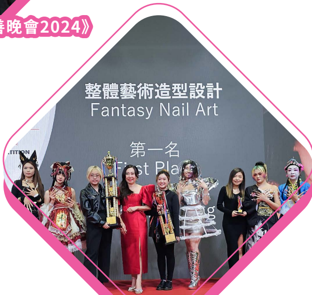
參加香港專業美甲師同業協會 美甲大賽2023並獲多個獎項