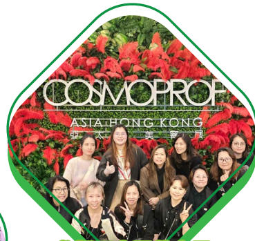
參觀亞太區美容展