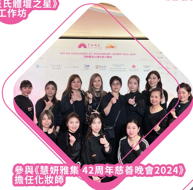
參與《慧妍雅集 42周年慈善晚會2024》 擔任化妝師