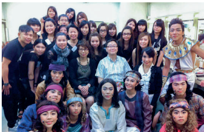
學生負責為沙田郭得勝中學舞台劇進行化妝造型