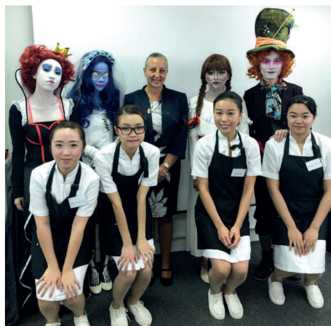
學生參加化妝國際證書考核